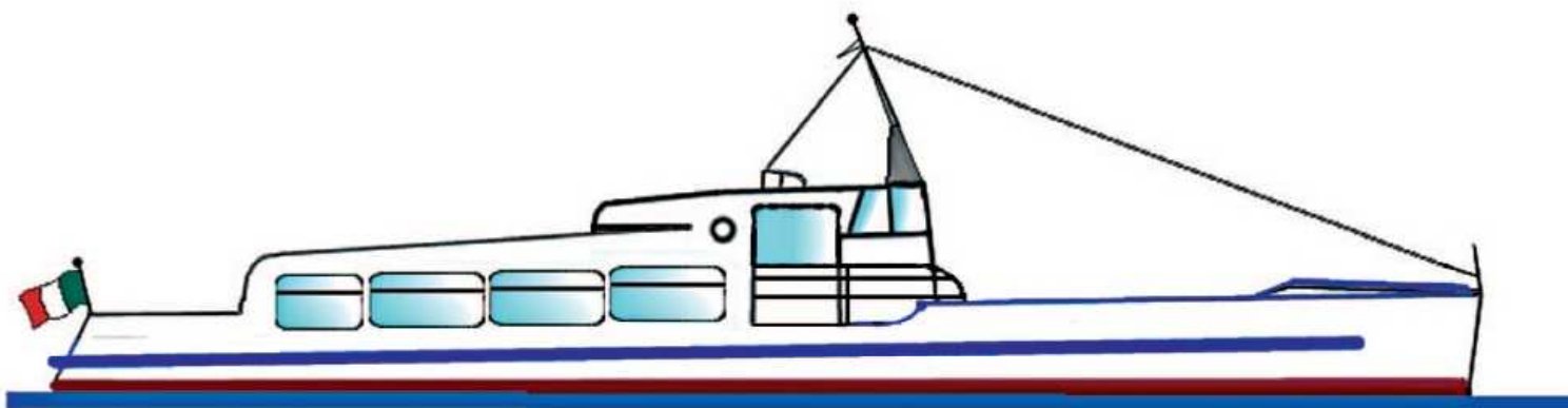
della stessa serie: Motoscafo ALCIONE - AQUILA - FALCO - GABBIANO